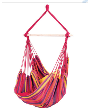
Vulcano • AZ-2020125 EAN 4030454003827