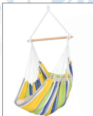
Kolibri • AZ-2020115 EAN 4030454003810