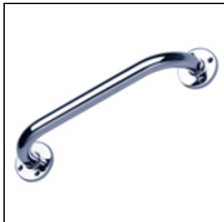
Barre d'appui droite, 300 mm